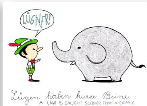
Lügen haben kurze Beine. A LIAR IS CAUGHT SOONER THAN A CRIPPLE.